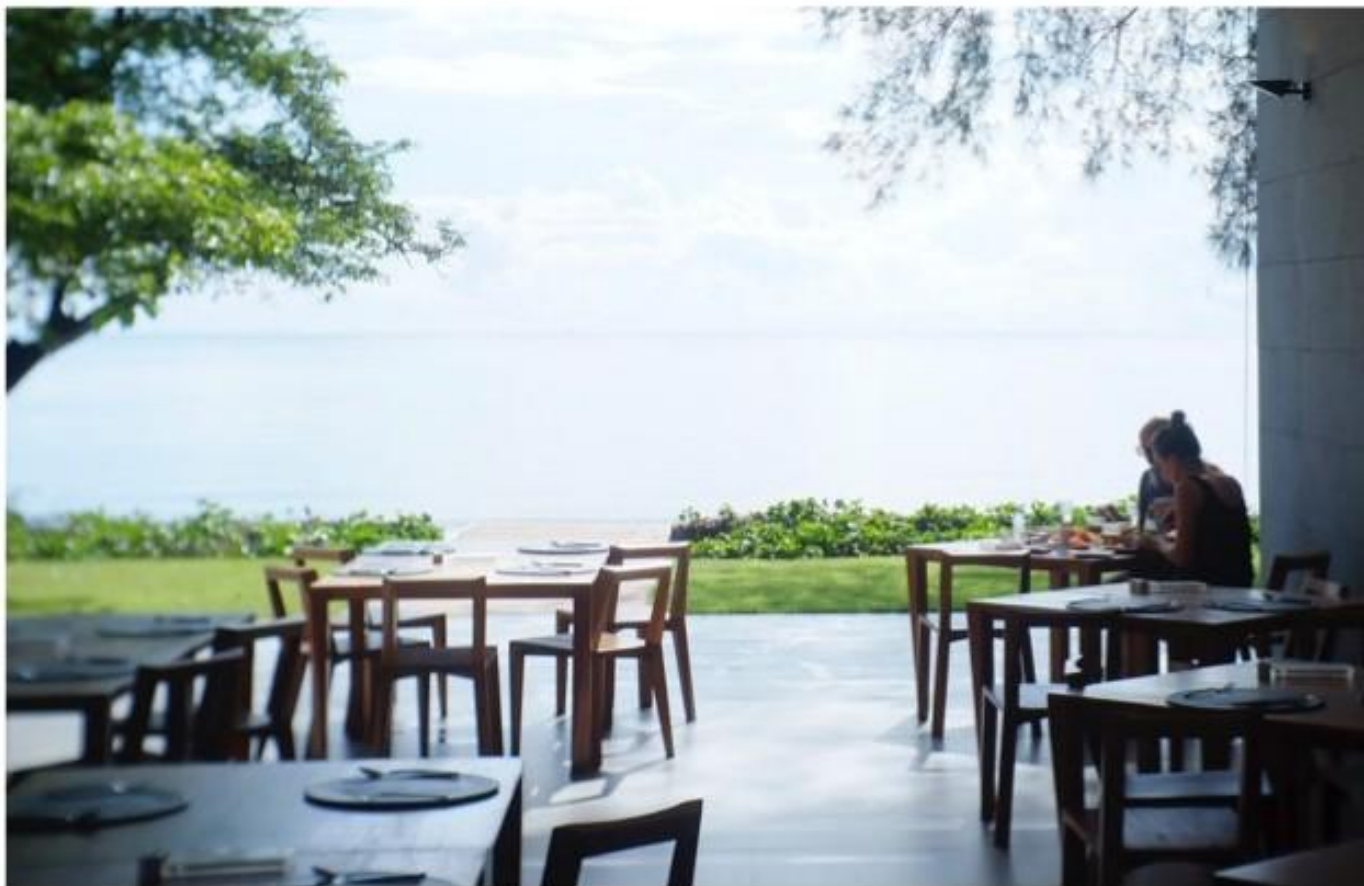
บรรยากาศโปร่งโล่งเปิดรับ ลมทะเลเย็นสบาย ภายในคือ อาหาร 4K (4K) ที่ไม่ธรรมดา รับประทานอาหารตอนเย็น ก็ยังมีที่จอดรถให้บริการ

อีกหนึ่งการเดินที่ช่วยเพิ่มมิติคือ การ รับปะทานอากาศรอบๆให้เย็นห้อง ณ ที่ซึ่งการ เห็นของสิ่งเดียวที่มีคือ 4K หรือ ฟังก์ชั่น ทีวีที่วางวางทุกที่ตั้งแต่ตัวบ้านถึง ผนังใช้ของ